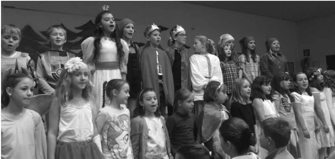
Im Bild die Darstellerinnen und Darsteller der Musicalaufführung.