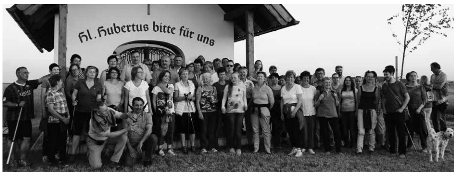
Die Gruppe der GG 2041 auf der Vollmondwanderung vor der Hubertuskapelle.

Am Dienstag, den 2. Juni 2015 folgte in der Marktgemeinde Wullersdorf die zweite Vollmondwanderung dieses Jahres, organisiert von der Gesunden Gemeinde GG 2041, welche sich bei der Bevölkerung der Marktgemeinde größter Beliebtheit erfreuen.