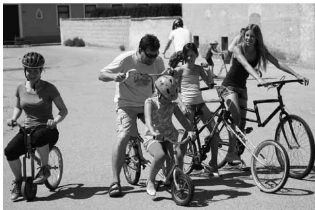
Das Radeln mit den lustigen Rädern bereitete Jung und auch Älter großen Spaß.

Über 100 Kinder haben sich im heurigen Jahr an den vom Bibliotheksteam organisierten abwechslungsreichen Aktivitäten beteiligt, die unter dem Motto „Das Beste aus 20 Jahren“ standen.